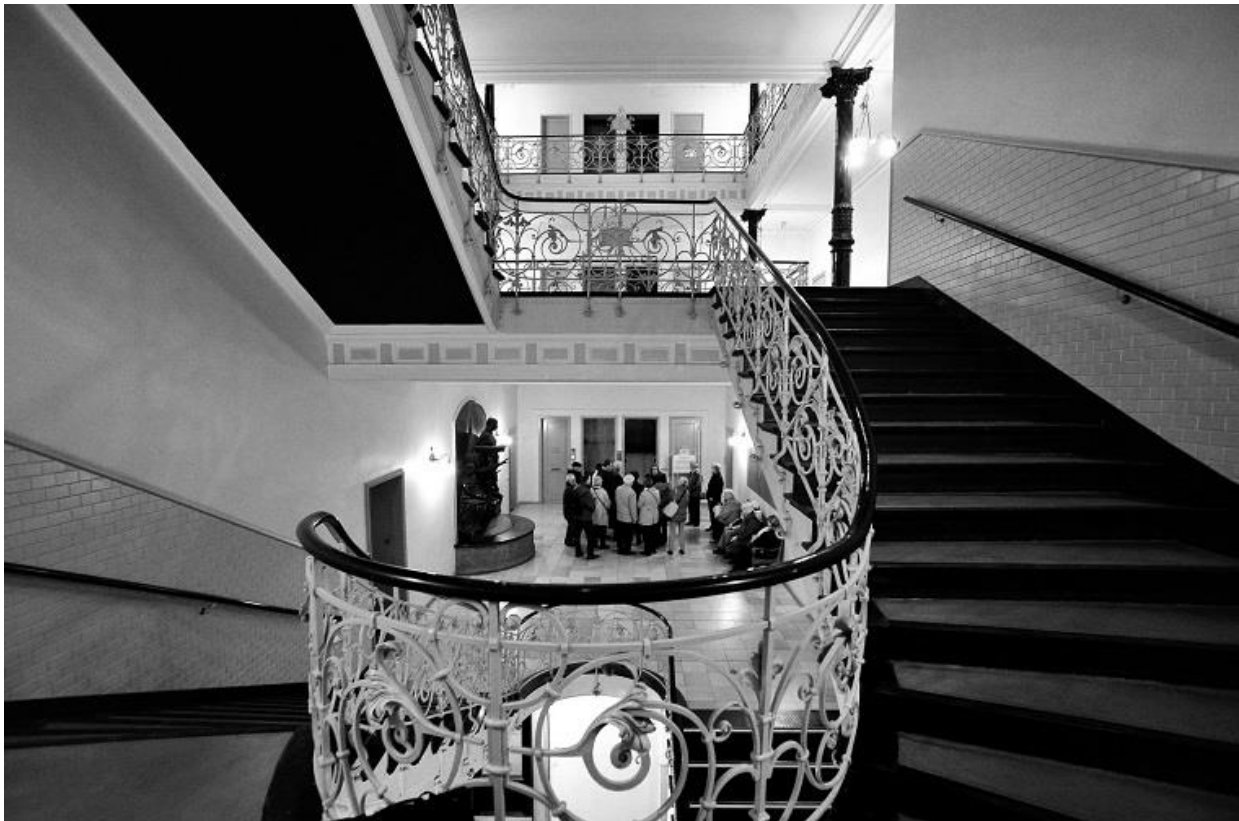
Laeiszhof (1897/98) / Unten: Sprinkenhof, Treppenhaus innen und außen (1927-43)