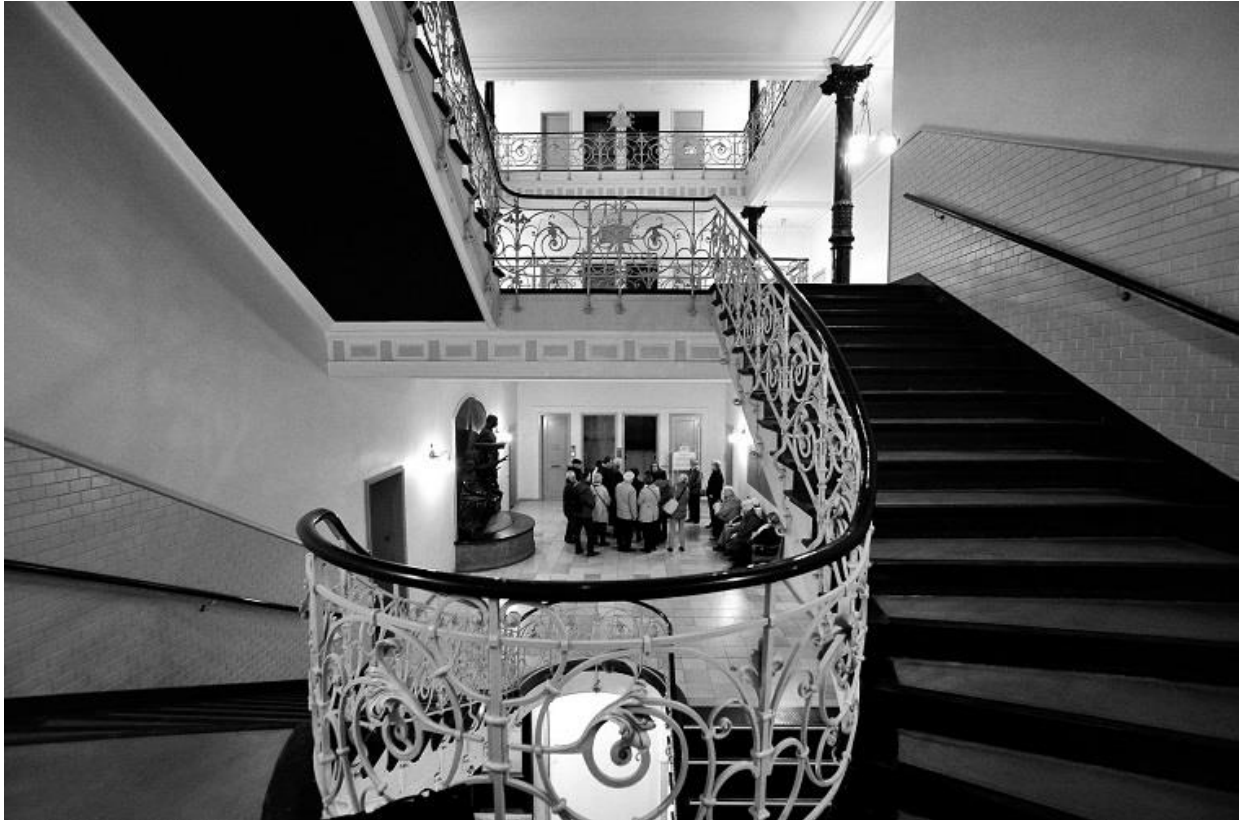
Laeiszhof (1897/98) / Unten: Sprinkenhof, Treppenhaus innen und außen (1927-43)