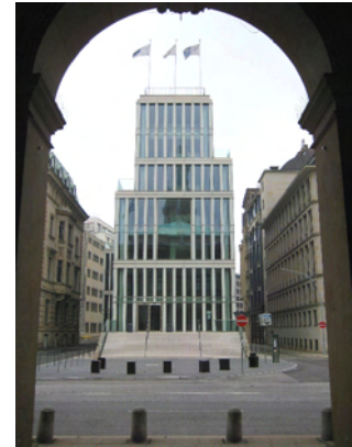
Oben: Das neue HKIC-Gebäude (Handelskammer InnovationsCampus) gegenüber der alten Börse

Anschließend besuchen wir gemeinsam das „Lunchkonzert“ in den Börsenarkaden. Einmal im Monat laden die Handelskammer Hamburg und der Hamburger Kammerkunstverein dazu ein. Im stimmungsvollen Ambiente der Börsenarkaden finden die Besucher eine Auszeit vom Alltags- und Geschäftsleben: Genießen Sie Ruhe und Entspannung bei klassischer Musik.