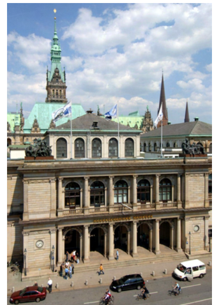
Unten: Die Börse von 1841 Dahinter ihr „Anbau“: So nannten die Pfeffersäcke das 1897 fertiggestellte Rathaus